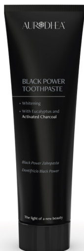
PHOTO DU PRODUIT